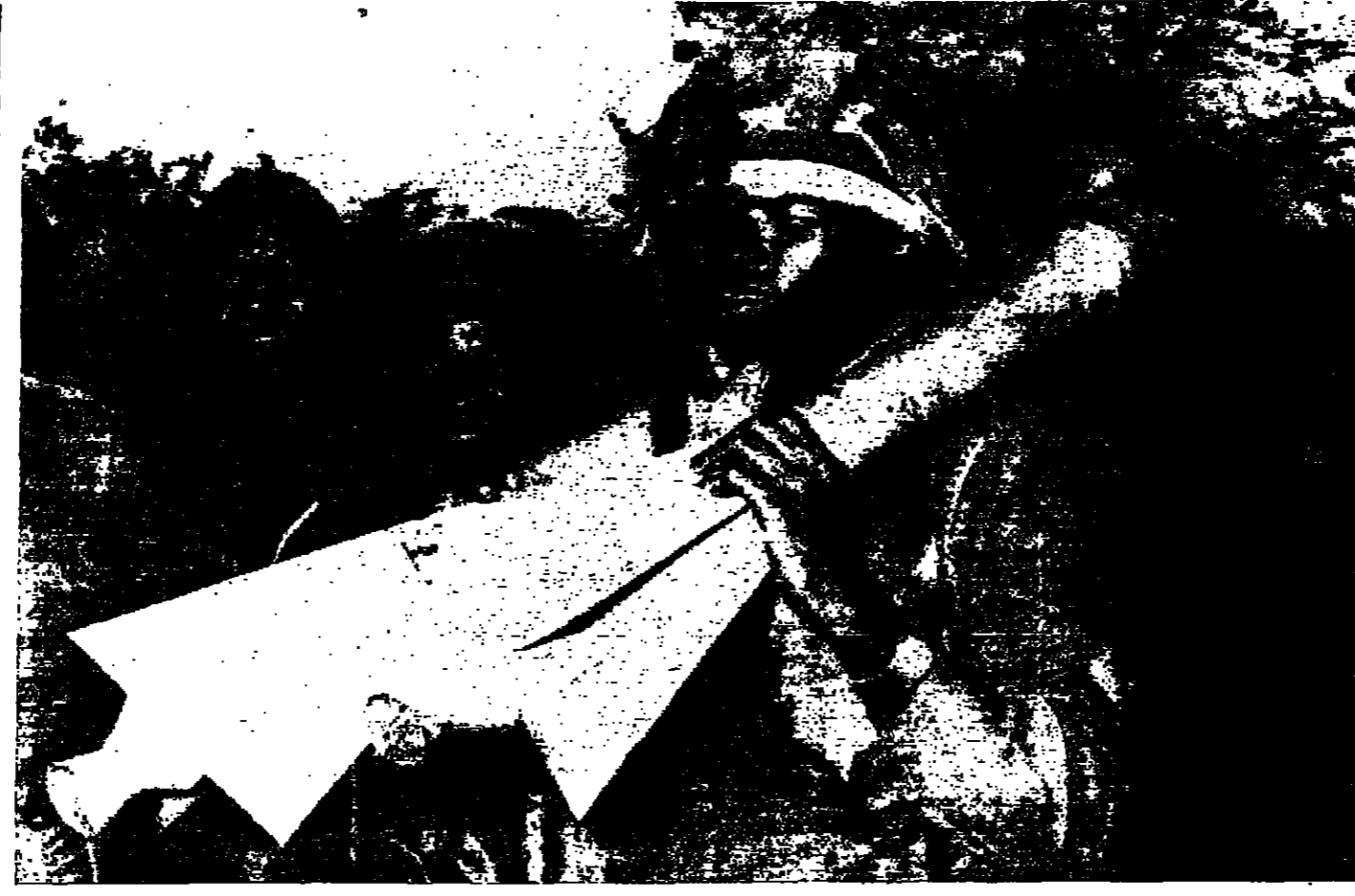
جندي نيجري اخلاي يعرض بفرضاصروخين غنمها القوات الاتحادية من القوات المتبردة في بياترا الإنصالية عندما استولت القوات الاتحادية على مدينة أونيلشا

أثينا تساهم بنققات أت البريطانية بالأرمن وقد قامت ألمانيا الغربية بناد تنفيذ مائة مائة بنق حيسمئة مليون خلال العام الماضي في تكاليف اقلية ت البريطنانية في الأراضي الالمانية.